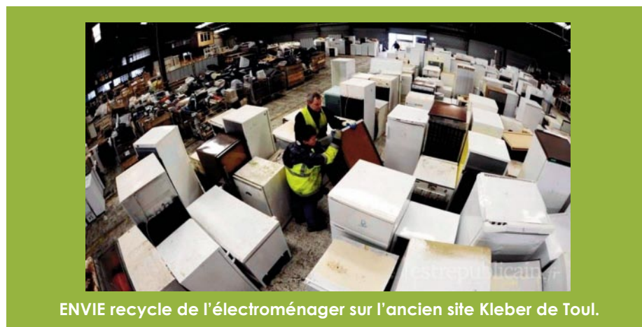
ENVIE recycle de l'électroménager sur l'ancien site Kleber de Toul.

« Il s'agit d'identifier les idées, les initiatives et de créer les meilleures