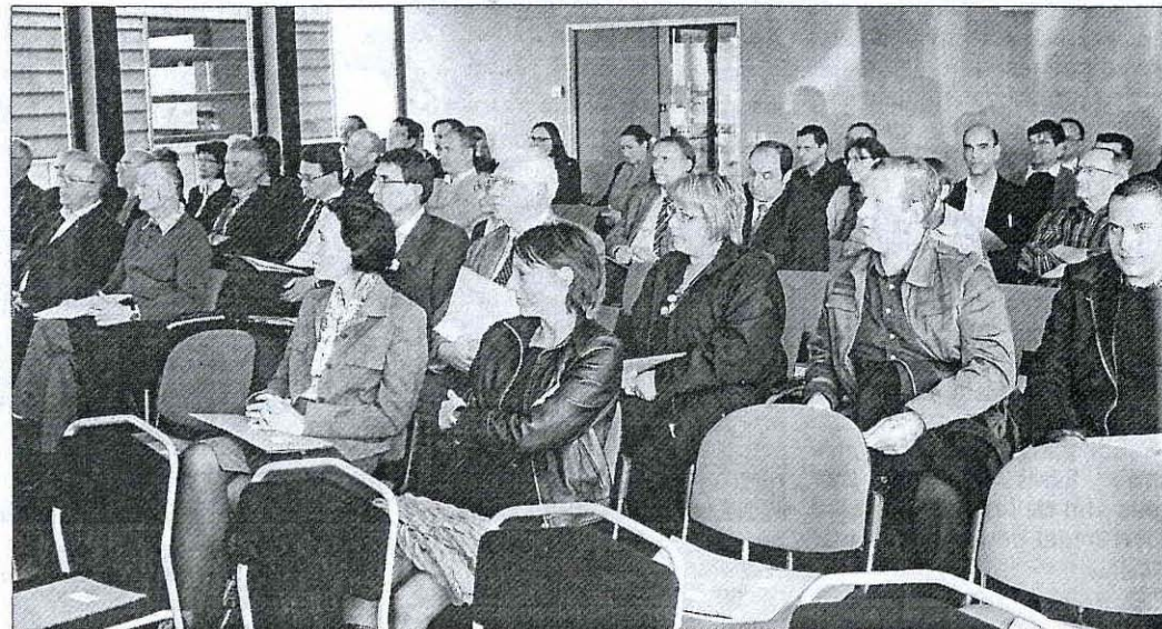
Une cinquantaine de personnes ont assisté à la conférence sur le développement durable en entreprise.