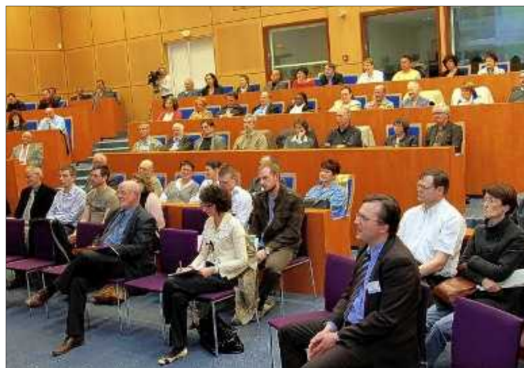
La centaine de participants ont salué unanimement les qualités d'orateur de Jean-Marie Pelt.

le député, les pensions de retraite augmenteront au 1er avril de 2,1 %. L'inflation se situera à 1,8 %, comme Christine Lagarde l'a annoncé. Il y a donc 0,3 % de rattrapage, conformément à l'engagement que jamais les pensions de retraite n'augmentent moins vite que l'inflation » Le ministre a ajouté : « Je tiens à dire qu'avec la crise, dans certains pays européens, notamment en Allemagne, les pensions de retraite ont été gelées [...]. Pour notre part [...], nous estimons que ce lien établi avec l'inflation garantit le pouvoir d'achat des retraités. Quant au minimum vieillesse, il augmentera de 4,7 % au 1er avril. Nous avons pris l'engagement de le revaloriser de 25 % sur cinq ans : cet engagement est tenu. Encore une fois, il s'agit d'une garantie de pouvoir d'achat. Les 600 000 titulaires d'une pension de réversion ont également bénéficié d'une revalorisation. En tous ces domaines, nous veillons à ce que l'inflation n'entame pas le pouvoir d'achat des retraités. [...] »