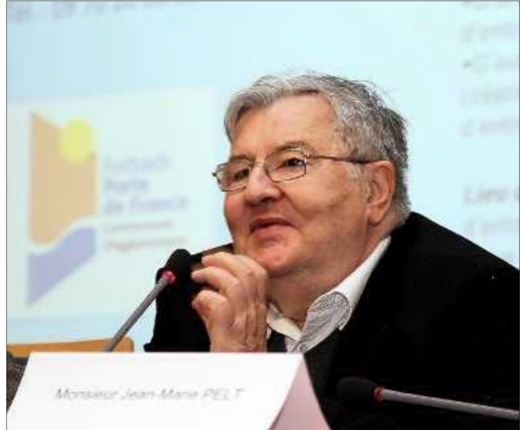
Durant plus d'une heure, Jean-Marie Pelt a captivé l'auditoire sur le thème "L'évolution : que savons-nous de ses limites et des liens insoupçonnés entre les espèces ?"