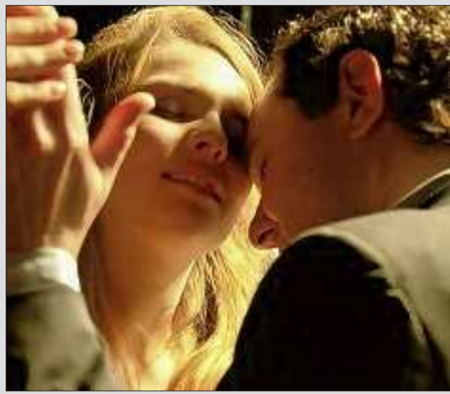
Barbe-bleue, espoir des femmes est une pièce de théâtre, de Dea Loher, auteure allemande contemporaine.

Le Carreau Scène nationale propose aujourd'hui et demain à 20 h au Cac de Forbach, la pièce de théâtre Barbe-bleue, espoir des femmes , de Dea Loher. Dans le conte de Perrault, Barbe-bleue tue les femmes pour les punir de leur curiosité. Chez Dea Loher, auteure allemande contemporaine, il est vendeur de chaussures. Il tue les femmes parce qu'elles cherchent un amour au-delà de toute mesure. Barbe-bleue, espoir des femmes tord le cou au romantisme. A la fois drôle et profonde, cette version moderne de la légende de l'homme qui assassina sept femmes nous confronte à une seule énigme : qui est-on face à l'autre ? Tarifs de 6 à 20 €. Réservations au Cac de Forbach de 14 h à 18 h, au 03 87 84 64 34. Jeudi 31 mars et vendredi 1er avril à 20 h au Cac de Forbach.